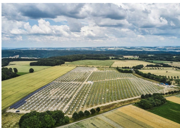
Neuer Boreas-Solarpark Ferschweiler in Rheinland-Pfalz mit 17,7 MWp: Inbetriebnahme Q1-2023 geplant.

Darüber hinaus ist das Portfolio an einer Beteiligung aus unserem eigenen Hause – CAV Solarinvest IV – beteiligt, die sich auf den mittelbaren Erwerb von Solar- und Photovoltaikanlagen in Italien fokussiert.